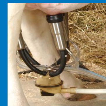
La MAX vous assure un meilleur débit grâce à son collecteur de sortie placé en position basse.

Contactez votre concessionnaire BouMatic pour une démonstration de la MAX sur votre ferme. Voyez par vous-même pourquoi la Flo Star MAX est devenue le nouveau standard pour la traite.