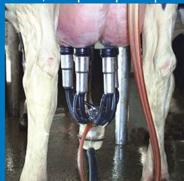
La Max s'aligne parfaitement, peu importe la position des trayons

La griffe à lait Flo Star MAX a une capacité de plus de 340ml, ce qui la place parmi les plus grandes sur le marché. Même les grosses productrices ne peuvent engorger la MAX.